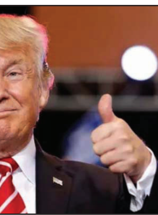
ਕਹਿਣਾ ਹੈ ਕਿ ਇਹ ਨਵਾਂ ਸਿਸਟਮ ਅਤਿਵਾਦ, ਫ਼ਰਜ਼ੀ ਦਸਤਾਵੇਜ਼, ਖ਼ਤਰਿਆਂ ਨਾਲ ਨਜਿੱਠੇਗਾ। ਇਹ ਵੀਜ਼ਾ ਤੋਂ ਵੱਧ ਸਮਾਂ ਰੁਕਣ ਅਤੇ

ਵਾਸ਼ਿੰਗਟਨ: ਰਾਸ਼ਟਰਪਤੀ ਡੋਨਲਡ ਟਰੰਪ ਦੀ ਸਖ਼ਤ ਇਮੀਗ੍ਰੇਸ਼ਨ ਪੌਲਿਸੀ ਤਹਿਤ ਅਮਰੀਕਾ 'ਚ ਹੁਣ ਹਰ ਵਿਦੇਸ਼ੀ ਦੀ ਐਂਟਰੀ ਅਤੇ ਐਗਜ਼ਿਟ ਵੇਲੇ ਫ਼ੋਟੋ ਲਈ ਜਾਵੇਗੀ। ਇਹ ਕੰਮ ਨਵੀਂ ਫ਼ੋਸ ਰੈਕੋਰਡੀਸ਼ਨ ਤਕਨੀਕ ਨਾਲ ਹੋਵੇਗਾ। ਇਸ ਦਾ ਮਕਸਦ ਫ਼ਰਜ਼ੀ ਦਸਤਾਵੇਜ਼ਾਂ ਨੂੰ ਰੋਕਣਾ ਅਤੇ ਦੇਸ਼ ਨੂੰ ਸੁਰੱਖਿਅਤ ਰੱਖਣਾ ਹੈ। ਅਮਰੀਕੀ ਬਾਰਡਰ ਸੈਕਿਓਰਿਟੀ ਡਿਪਾਰਟਮੈਂਟ (CBP) ਨੇ ਦੱਸਿਆ ਕਿ ਹਵਾਈ ਐਂਡਿਆਂ, ਸਮੁੰਦਰੀ ਬੰਦਰਗਾਹਾਂ ਤੇ ਜ਼ਮੀਨੀ ਹੱਦਾਂ 'ਤੇ ਫ਼ੋਟੋਆਂ ਅਤੇ ਜਾਣਕਾਰੀ ਇਕੱਠੀ ਕੀਤੀ ਜਾਵੇਗੀ। CBP ਦਾ