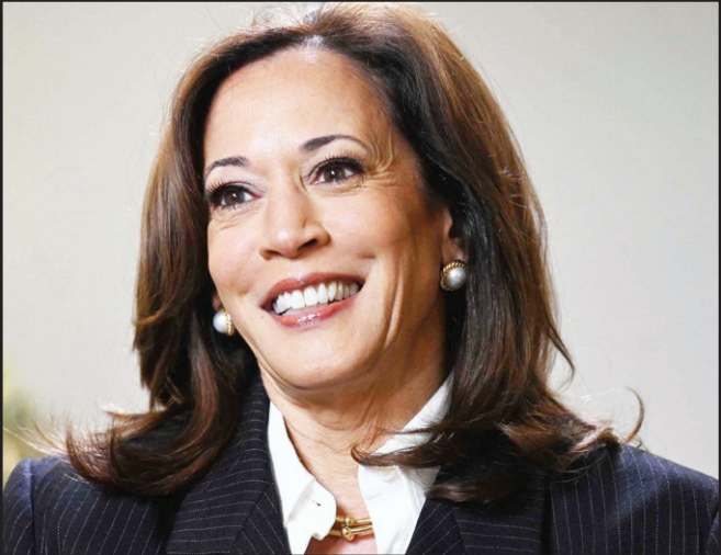
ਵਜੋਂ ਹੈਰਿਸ ਦੇ ਤਜਰਬੇ 'ਤੇ ਕੇਂਦ੍ਰਿਤ ਹੈ ਕਿਉਂਕਿ ਉਸ ਸਮੇਂ ਦੇ

ਵਾਸ਼ਿੰਗਟਨ: ਕਮਲਾ ਹੈਰਿਸ ਨੇ ਅਮਰੀਕੀ ਰਾਸ਼ਟਰਪਤੀ ਅਹੁਦੇ ਦੀ ਦੌੜ 'ਚ ਦੁਬਾਰਾ ਸ਼ਾਮਲ ਹੋਣ ਦੀ ਸੰਭਾਵਨਾ ਤੋਂ ਇਨਕਾਰ ਨਹੀਂ ਕੀਤਾ। ਇੱਕ ਨਿਊਜ਼ ਚੈਨਲ ਨਾਲ ਇੱਕ ਇੰਟਰਵਿਊ 'ਚ ਹੈਰਿਸ ਨੇ ਕਿਹਾ ਕਿ ਉਸ ਨੂੰ ਉਮੀਦ ਹੈ ਕਿ ਆਉਣ ਵਾਲੇ ਸਾਲਾਂ 'ਚ ਇੱਕ ਔਰਤ ਰਾਸ਼ਟਰਪਤੀ ਬਣੇਗੀ ਅਤੇ ਸੰਭਵ ਤੌਰ 'ਤੇ ਉਹ ਹੋ ਸਕਦੀ ਹੈ। ਉਨ੍ਹਾਂ ਕਿਹਾ, “ਮੈਂ ਹੁਣ ਤਕ ਹਾਰ ਨਹੀਂ ਮੰਨੀ।” ਸਾਬਕਾ ਉਪ ਰਾਸ਼ਟਰਪਤੀ ਨੇ ਕਿਹਾ ਕਿ ਉਸ ਨੇ ਅਜੇ ਤਕ 2028 'ਚ ਰਾਸ਼ਟਰਪਤੀ ਅਹੁਦੇ ਲਈ ਚੋਣ ਲੜਨ ਬਾਰੇ ਕੋਈ ਫ਼ੈਸਲਾ ਨਹੀਂ